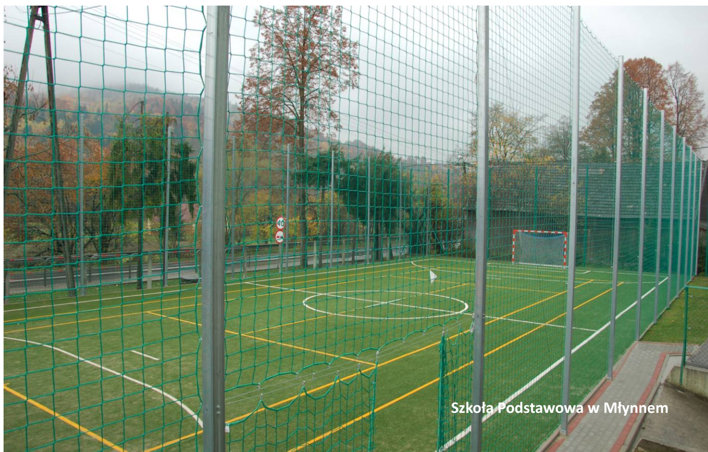
Szkoła Podstawowa w Młynnem

Poprzez ciągłą rozbudowę bazy sportowej gmina Limanowa dokłada wszelkich starań by zapewnić dobre warunki do aktywnego spędzania czasu i prawidłowego rozwoju mieszkańców.