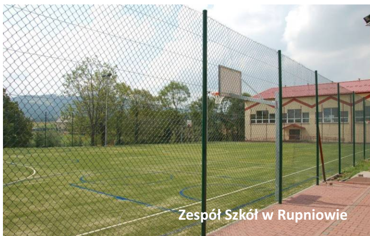
Zespół Szkół w Rupniowie

Boisko szkolne powinno być tak zaprojektowane, by uwzględniać silną eksploatację podczas zajęć wychowania fizycznego, a także zajęć pozalekcyjnych. Winno również spełniać podstawowe warunki bezpieczeństwa. Dlatego też gmina Limanowa stopniowo inwestuje w wielofunkcyjne boiska przyszkolne. Dotychczas takie obiekty znajdowały się w Mordarce, Męcinie, Pisarzowej, Starej Wsi I, Starej Wsi II, Nowym Rybiu i Kaninie. W mijającej kadencji przyszkolnych boisk doczekali się również uczniowie z Rupniowa i Młynnego. Koszt budowy obiektów to 320 tysięcy złotych.