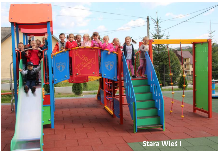
Stara Wieś I

Na terenie gminy Limanowa funkcjonuje 14 przyszkolnych placów zabaw i aż 13 udało się wykonać w ciągu ostatnich czterech lat. Budowę 5 placów zabaw zrealizowano ze środków budżetu gminy, natomiast powstanie pozostałych współfinansowane było z programów „Upowszechnianie edukacji przedszkolnej w gminie Limanowa” oraz „Radosna Szkoła”. Kolorowe place zabaw stały się miejscami bezpiecznej i wesołej zabawy.