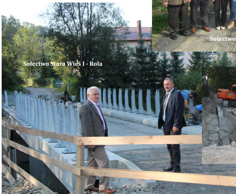
Sołectwo Stara Wieś I - Rola