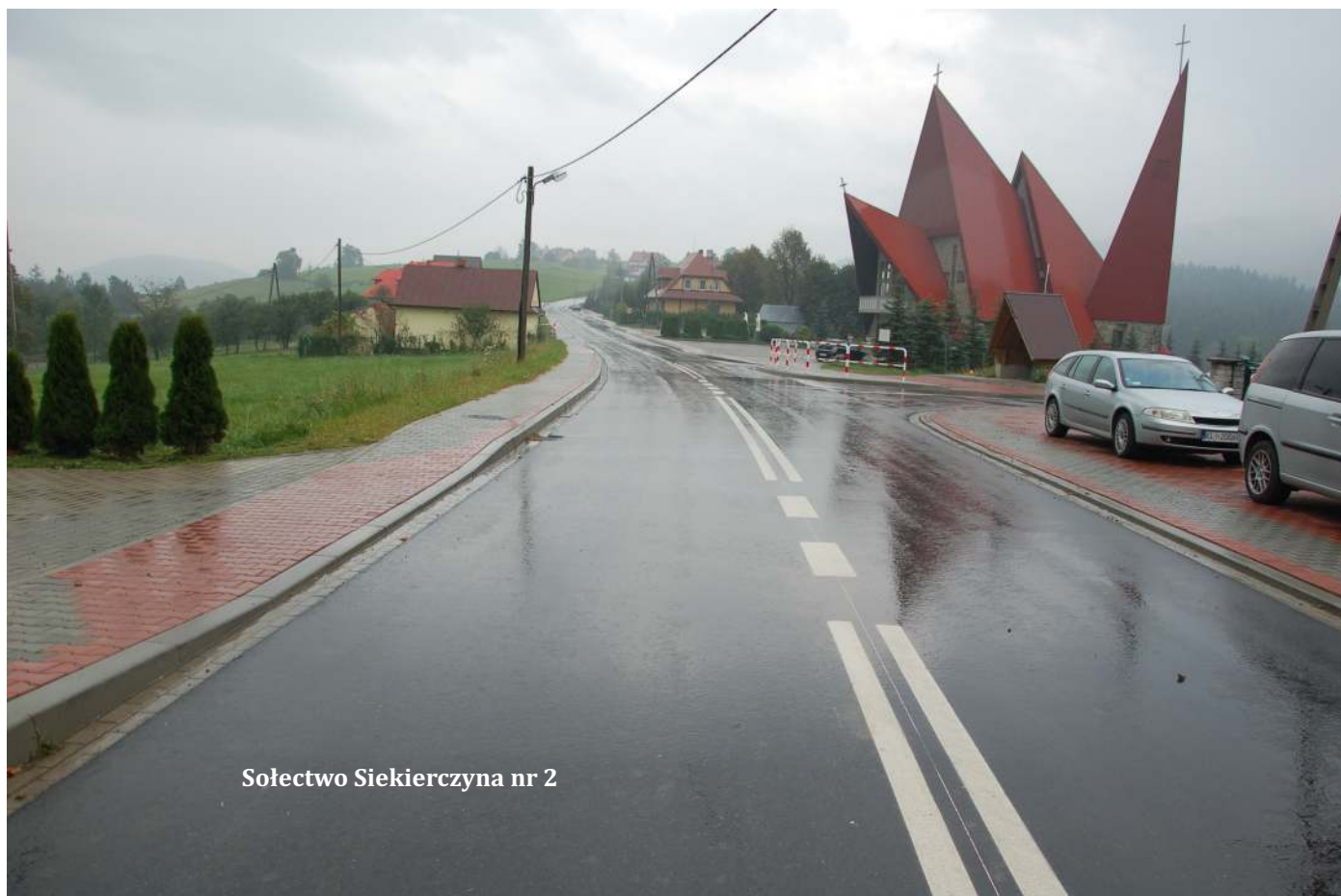
Sołectwo Siekierzyna nr 2

W związku z trwającymi pracami przy budowie dróg i chodników oraz modernizacji mostów na terenie gminy Limanowa mogą wystąpić utrudnienia w ruchu, za które przepraszamy i prosimy o wyrozumiałość.