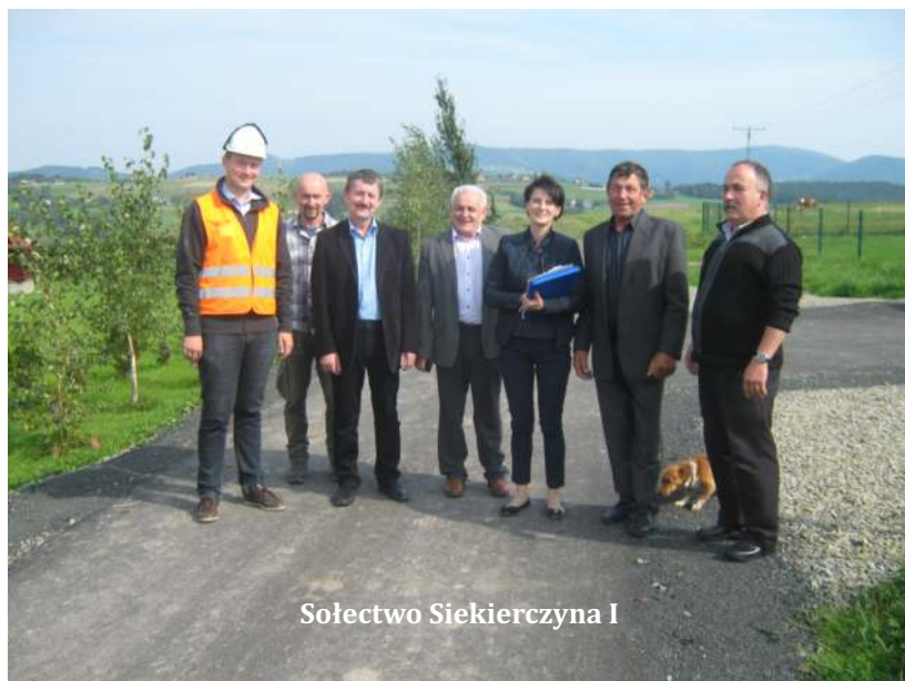
Sołectwo Siekierzyna I