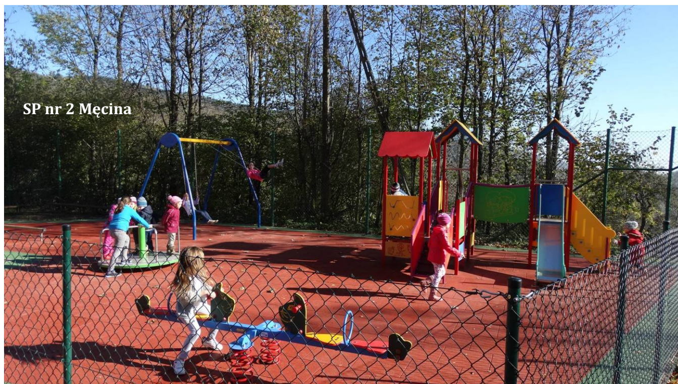
SP nr 2 Męcina

Największymi inwestycjami realizowanymi w ramach projektu była budowa nowych placów zabaw, które powstały przy szkołach podstawowych: w Kaninie, Kłodnem, w Męcinie nr 2, Nowym Rybiu oraz w Siekierczynie nr 2. Dzięki realizacji projektu znacznie podniosła się jakość funkcjonowania oddziałów przedszkolnych w gminnych placówkach oświatowych. Podjęte działania mają m.in. umożliwić dzieciom wyrównywanie szans edukacyjnych, zapewnić im wszechstronny rozwój oraz odpowiednio przygotować do podjęcia nauki w szkole. Powstałe place zabaw służyć mają zabawie, będąc jednocześnie miejscem aktywnego wypoczynku najmłodszych.