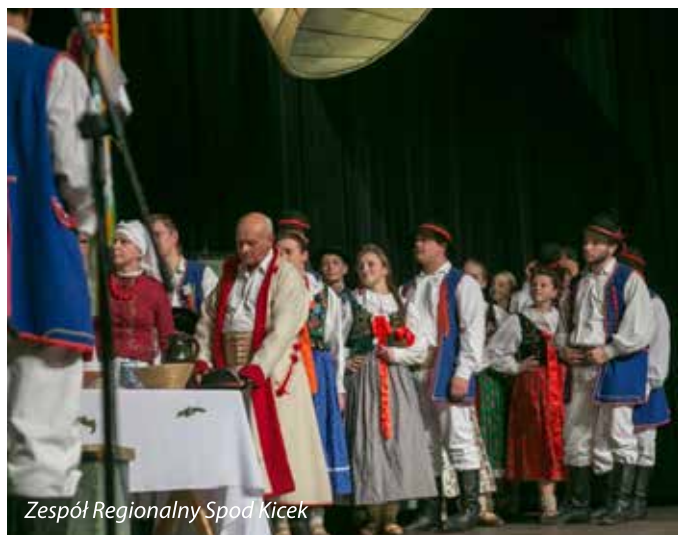
Zespół Regionalny Spod Kicek

Sukcesem zakończył się występ artystów z Gminy Limanowa na tegorocznym 41. Festiwalu Folklorystycznym „Limanowska Słaza”, który odbywał się w dn. 5-8 listopada br. w Limanowskim Domu Kultury. Wysokie miejsca udało się zająć zarówno zespołom oraz grupom, jak i indywidualnym twórcom: