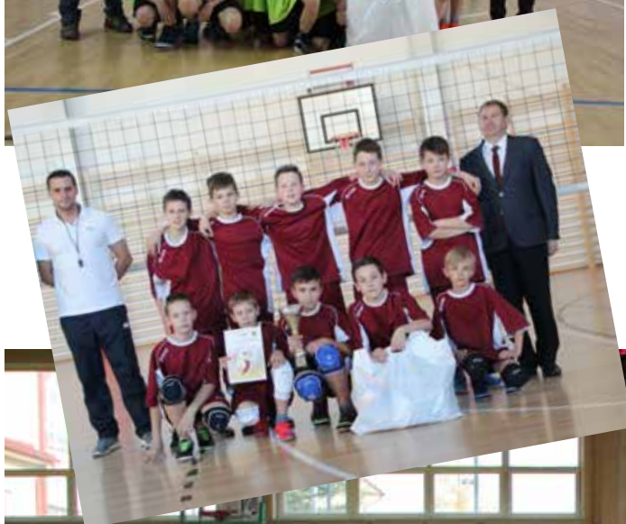
Uczestnicy Mistrzostw Gminy Limanowa w Tenisie Stołowym Dziewcząt i Chłopców, Kat. SP i Gimnazja: