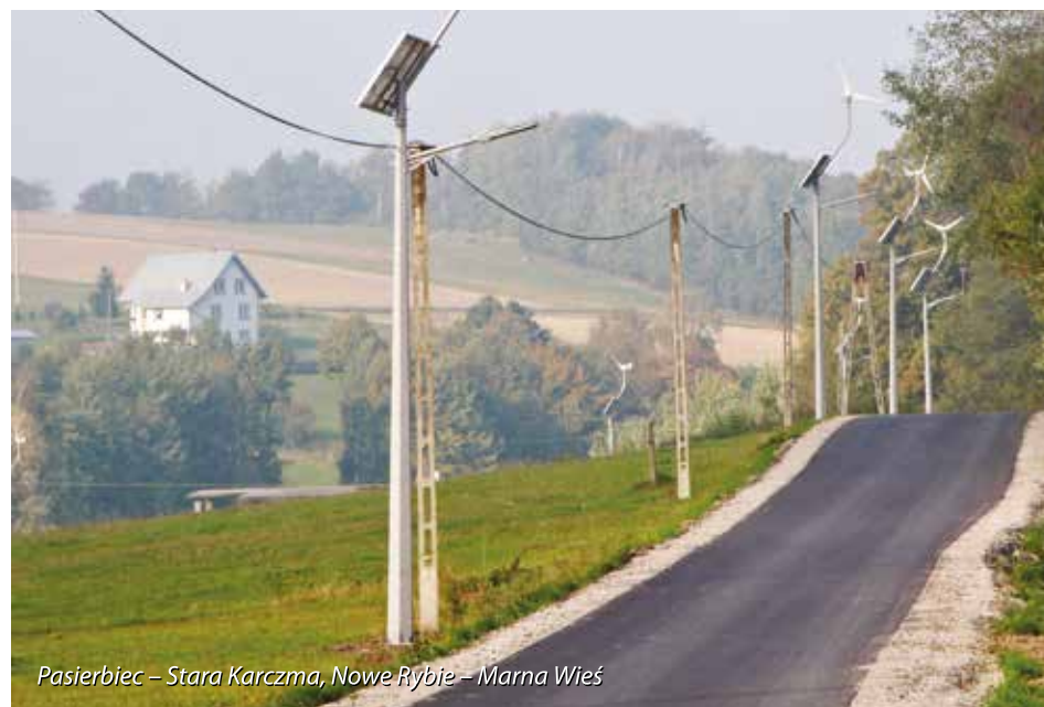
Pasierbiec – Stara Karczma, Nowe Rybje – Marna Wieś

Wszystkie zadania ukierunkowane są na zaspokajanie potrzeb mieszkańców i podnoszenie standardu życia gminnej społeczności. Oczywiście nie można na raz wykonać wszystkiego i wszystkim oczekiwaniom sprostać jednocześnie. Rozległość obszarowa gminy niesie za sobą ogrom potrzeb, a specyfika ukształtowania terenu determinuje nieraz powodzenie i możliwość szybkiej realizacji zadań i w tym miejscu potrzebna jest wyrozumiałość zarówno radnych, sołtysów, dyrektorów