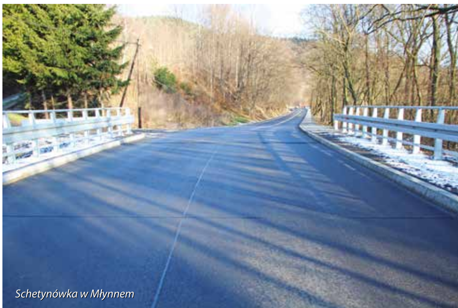
Schetynówka w Młynnem

Wiele zadań inwestycyjnych wykonano także w obiektach szkolnych, były to głównie prace modernizacyjne i remontowe mające ulepszyć funkcjonowanie placówek oraz podnieść standard nauczania uczniów. Na zadania te wydatkowaliśmy prawie 450 tys. zł. Najważniejszą i największą inwestycją oświatową jest rozpoczęta w bieżącym roku rozbudowa Szkoły Podstawowej nr 1 w Siekierzynie, gdzie powstanie m.in. sala gimnastyczna oraz kotłownia ze stołówką. Cała inwestycja kosztować będzie 2 mln 400 tys. zł. Nadmienić trzeba, że oświata pochłania ponad 40 % całego budżetu gminy wynoszącego 70 milionów złotych, jednak mimo to w trosce