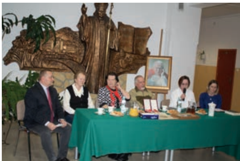
„Ktokolwiek ratuje jedno życie, ten jakby cały świat ratował” - SP nr 1 Męcina