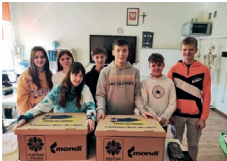
Paczka dla Ukrainy - SP Nowe Rybie