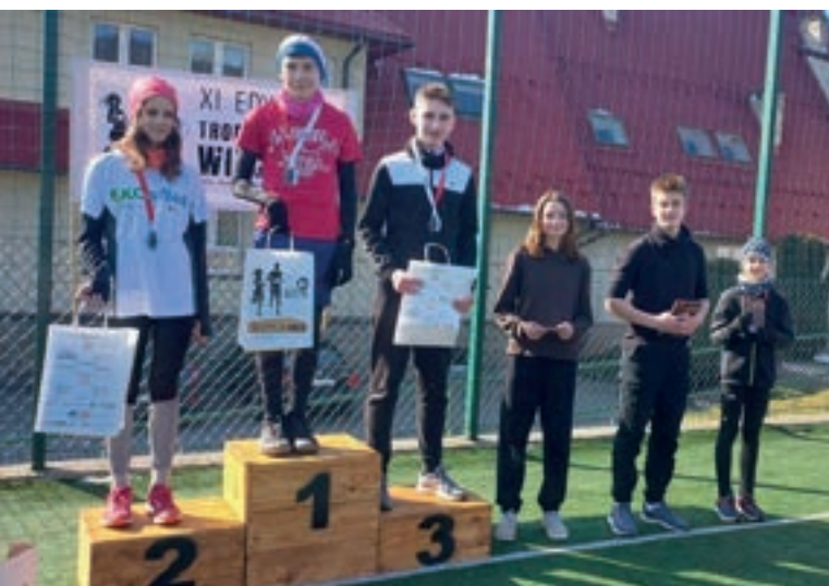
Wilczym tropem - SP Mordarka