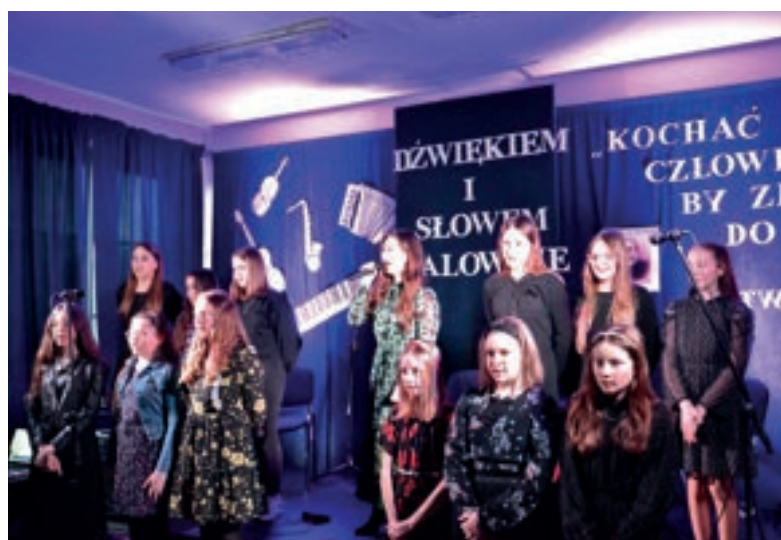
Wieczorek Poetycki - SP Kłodne