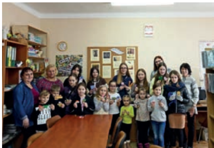
KGW Rupniów dla dzieci - Rupniów