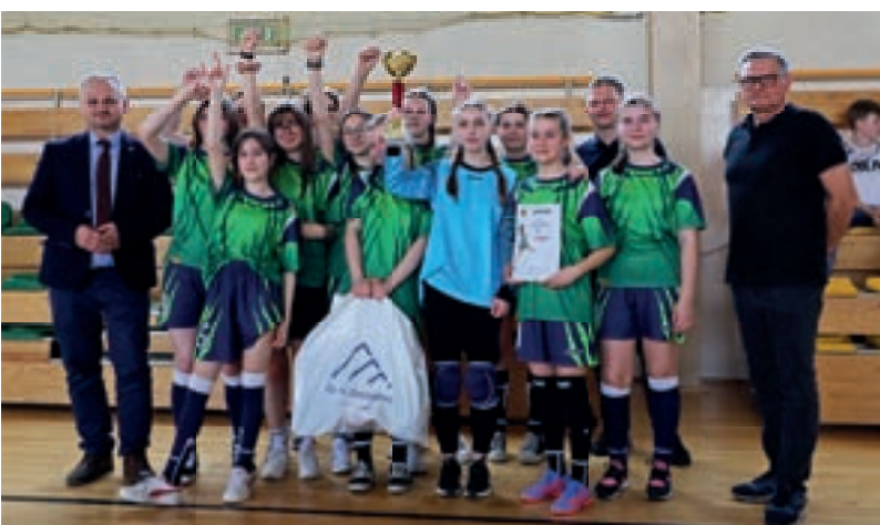
SP Rupniów - Piłka ręczna młodzieży