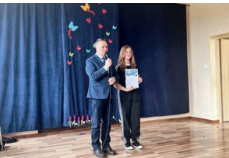
„Pomóż ocalić życie bezbronnemu” - SP Kłodne