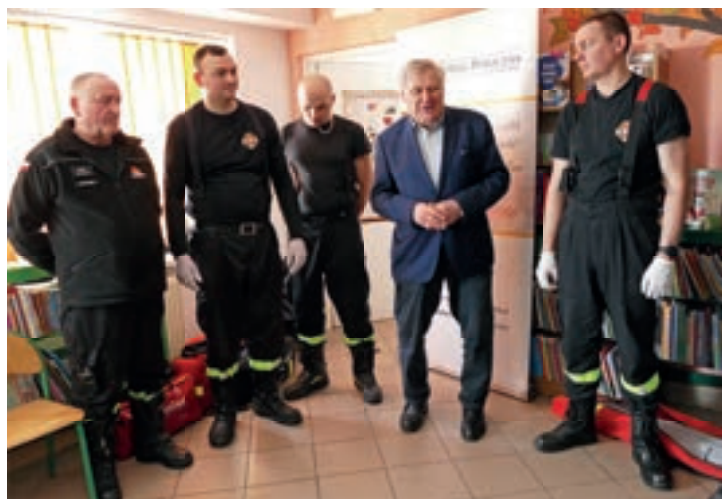
Bezpieczeństwo w pracy na roli i pierwsza pomoc - Kanina