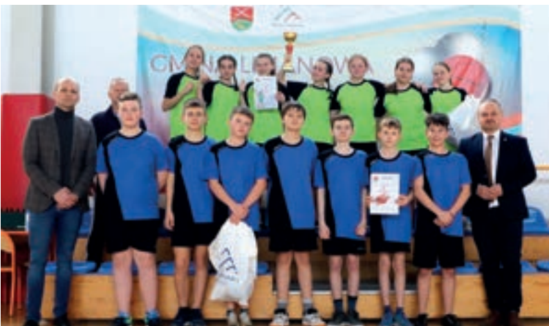
SP Pasierbiec - Koszykówka młodzieży