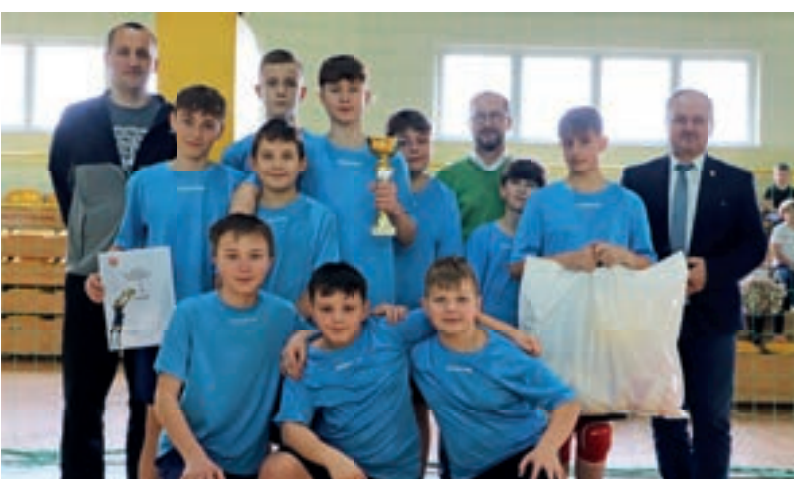
SP Mordarka - Siatkówka dzieci