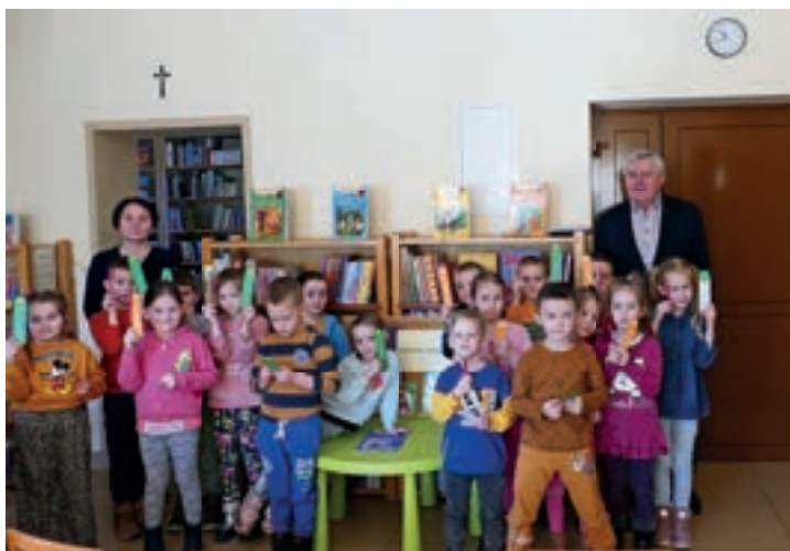
Przedszkolaki w bibliotece - Stara Wieś