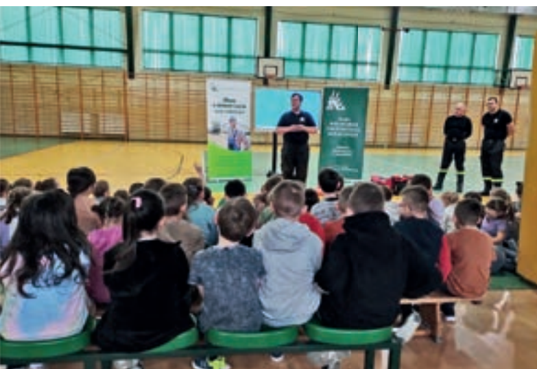
Spotkanie z OSP Wysokie - SP Mordarka