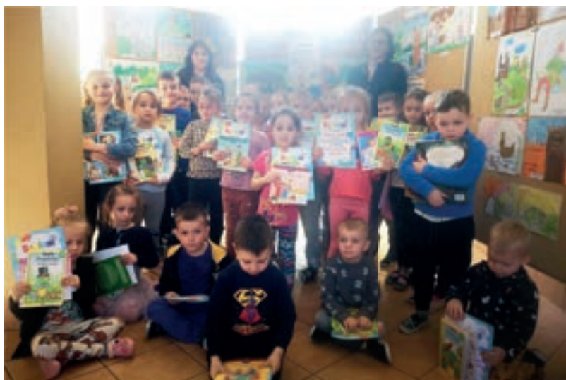
Poznajemy polskie legendy - SP nr 1 Stara Wieś