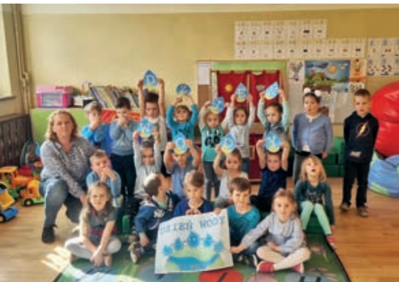
Światowy Dzień Wody - SP Pisarzowa