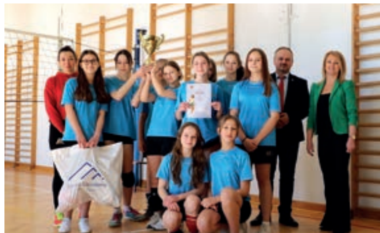
SP Mordarka - Siatkówka młodzieży