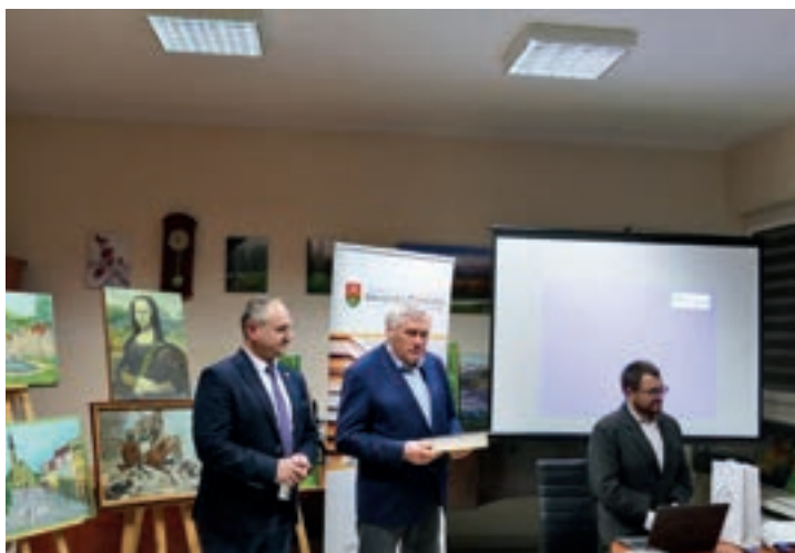
O ruchu ludowym w Powiecie Limanowskim - Pisarzowa