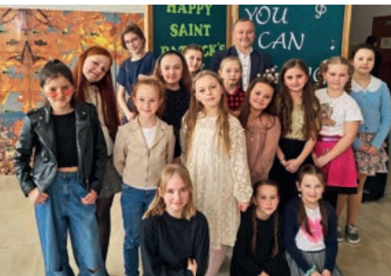
Dzień Św. Patryka - SP nr 1 Męcina