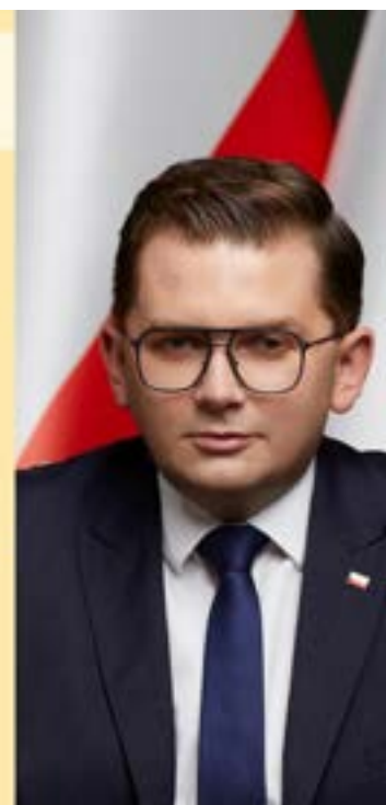
Łukasz Kmita WOJEWODA MAŁOPOLSKI