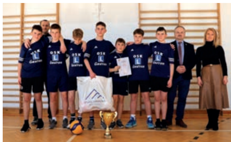
SP Mordarka - Siatkówka młodzieży