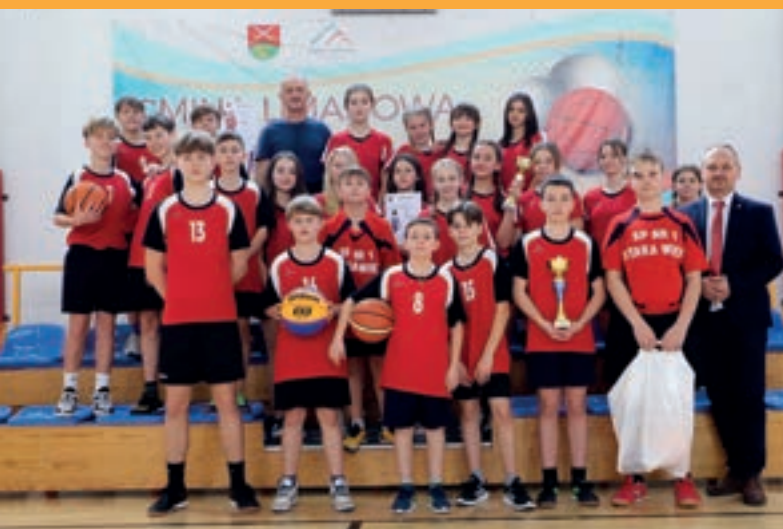
SP Stara Wieś - Koszykówka dzieci