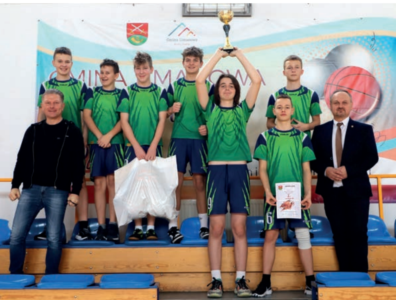
SP Rupniów - Koszykówka młodzieży