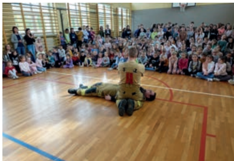
Spotkanie z OSP Męcina - SP nr 1 Męcina