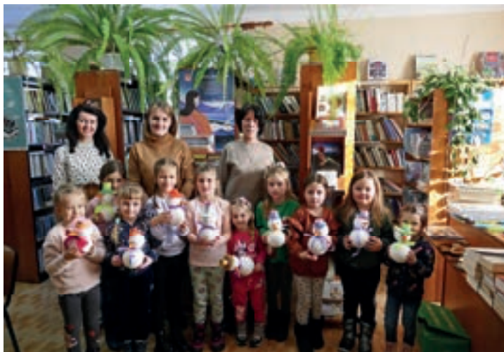
„Śnieżne bałwanki” - Rupniów