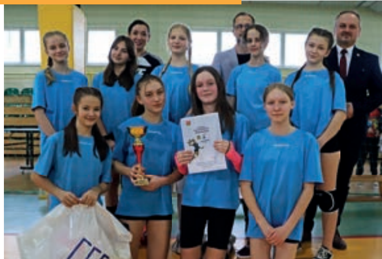
SP Mordarka - Siatkówka dzieci