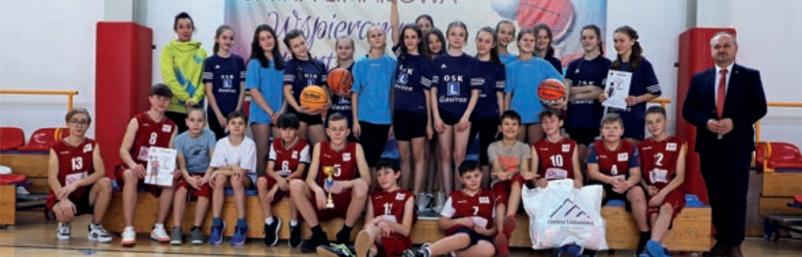
SP Mordarka - Koszykówka dzieci