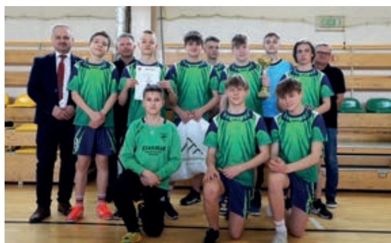
SP Rupniów - Piłka ręczna młodzieży