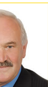
OWE n Zoń