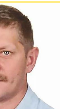
WIEŚ 2 Piszcze