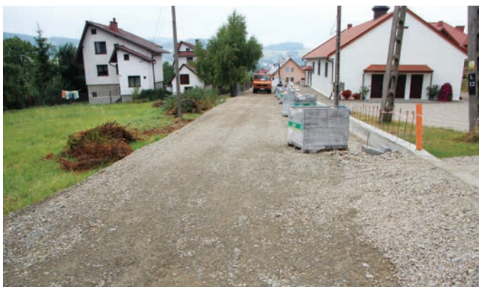
Mordarka do Tokarczyka