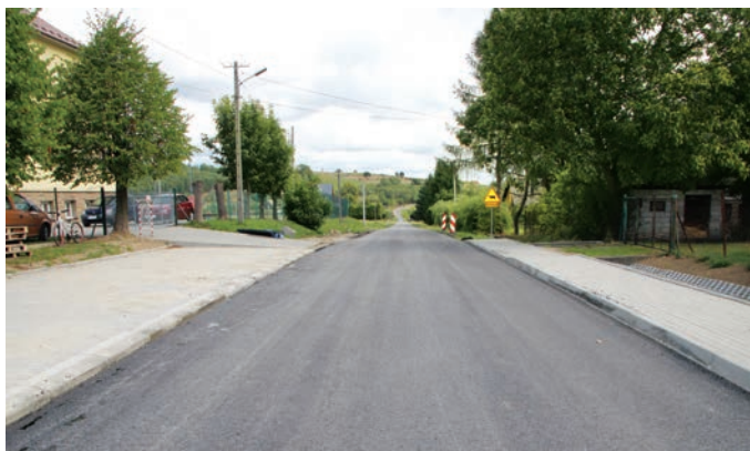
„Schetynówka” Pasierbiec – Nowe Rybie

Trwa modernizacja kolejnych odcinków dróg na terenie gminy Limanowa. Za 1 mln 800 tys. zł realizowana jest wieloetapowa inwestycja polegająca na przebudowie dróg gminnych Pasierbiec Stara Karczma - Nowe Rybie - Marna Wieś - Nowe Rybie Kamionna (tzw. „schetynówka”) na odcinku o długości ok. 5 km. Wykonawcą zadania jest firma „SKANSKA” S.A., a termin realizacji przedsięwzięcia to koniec września br.