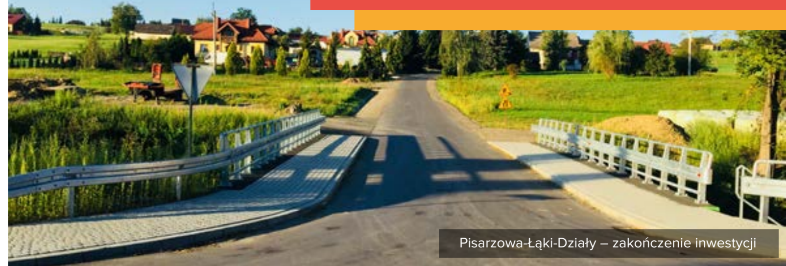
Pisarzowa-Łąki-Działy – zakończenie inwestycji

Za ponad 3,7 miliona złotych wykonana zostanie przebudowa 15 odcinków dróg.