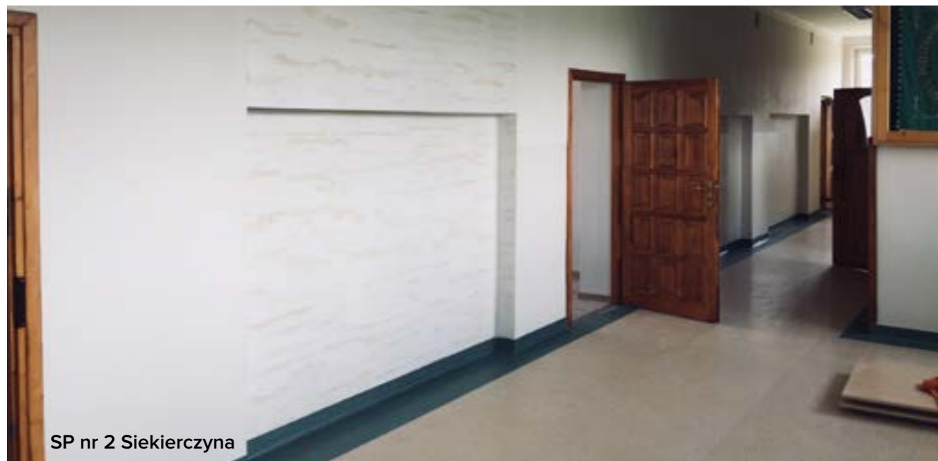
SP nr 2 Siekierczyna

Wymienione zostały posadzki w salach lekcyjnych oraz w pomieszczeniu biblioteki szkolnej, w części budynku położono panel podłogowy – prace wyniosły 49 815,00 zł.