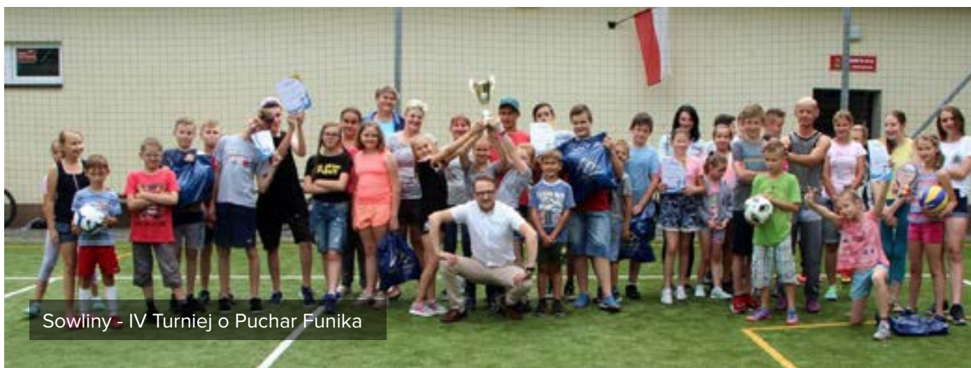
Sowliny - IV Turniej o Puchar Funika