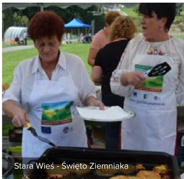
Stara Wieś - Święto Ziemiaka