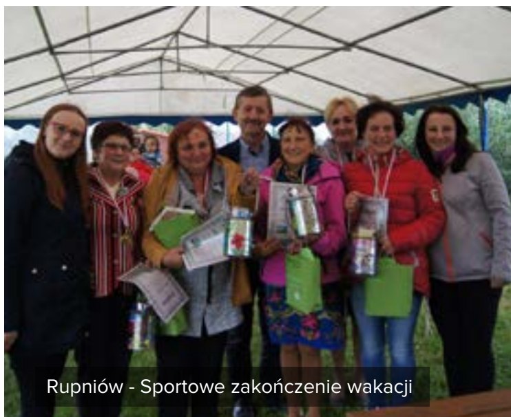
Rupniów - Sportowe zakończenie wakacji