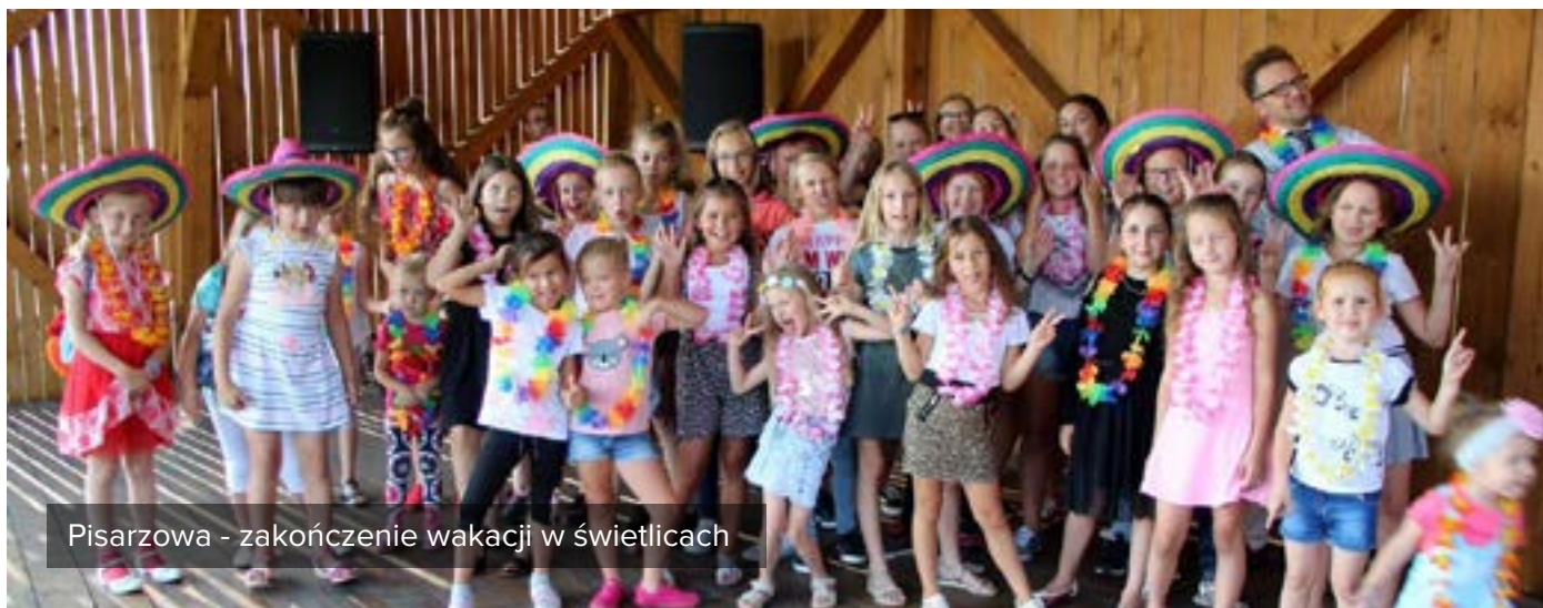
Pisarzowa - zakończenie wakacji w świetlicach