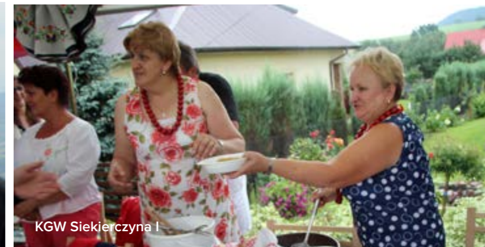
KGW Siekierczyna I

Otwarcie letniego sezonu turystycznego na górze Paproć, spotkanie turystów na górze Jaworz oraz Festiwal Kultury Beskidu Wyspowego „Beskidzkie Rytm i Smaki” - to turystyczno-kulturalne wydarzenia, które w okresie minionego lata odbyły się na terenie gminy Limanowa.