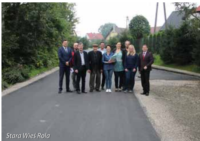
Stara Wieś Rola