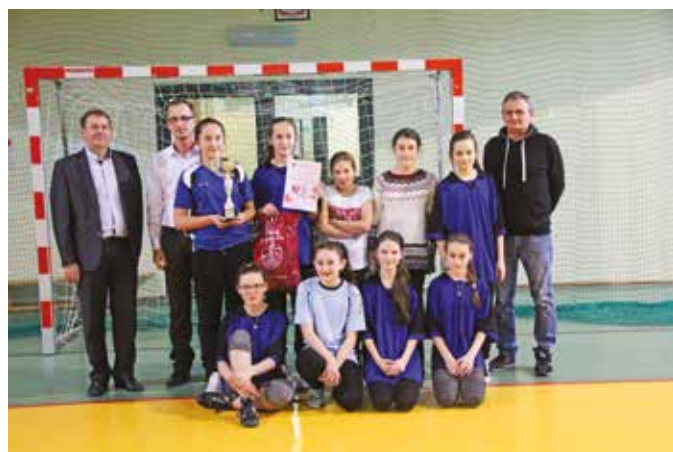
SP Rupniów – Mini Piłka Ręczna Dziewcząt