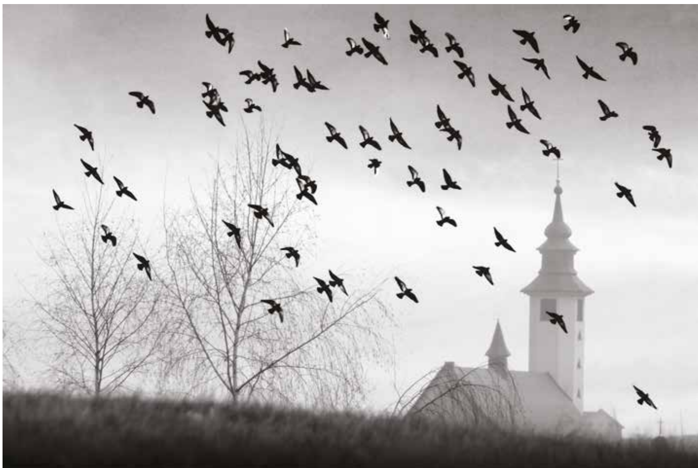
„Ptaki z widokiem na kościół w Mordarce”