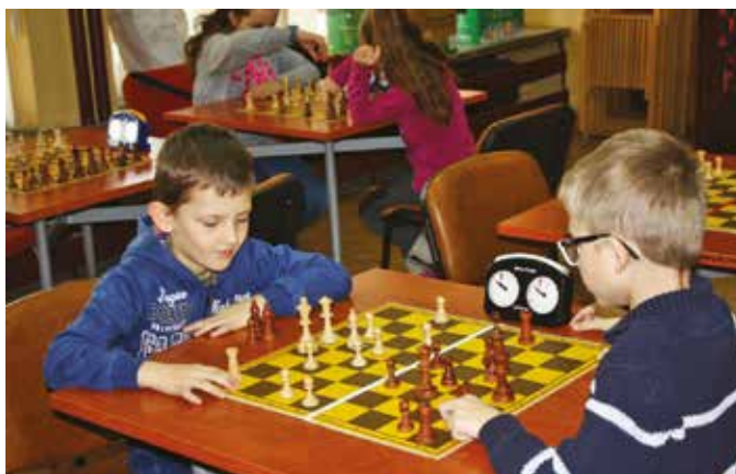
Zawody szachowo-warcabowe w bibliotece w Pisarzowej