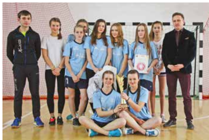
Gimnazjum Mordarka – Piłka Koszykowa Dziewcząt