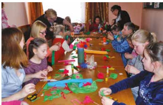
Kwiaty i inne ozdoby z bibuły w bibliotece w Rupniowie