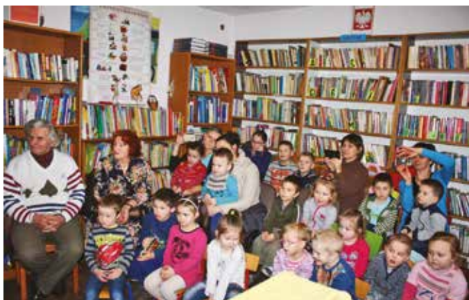
Maraton Teatralny w bibliotece w Męcinie