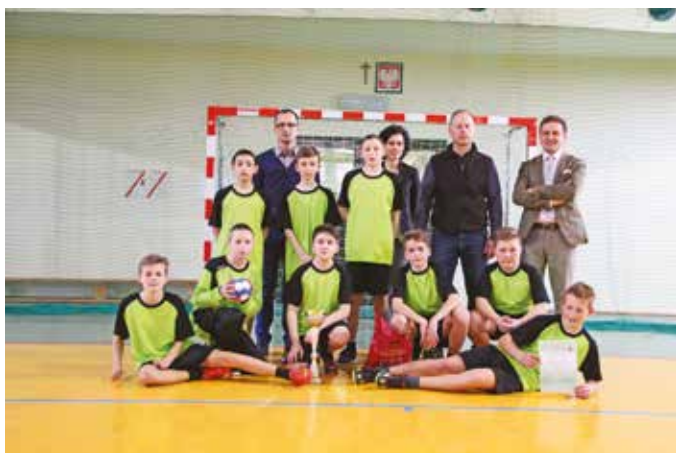
SP Pasierbiec – Mini Piłka Ręczna Chłopców