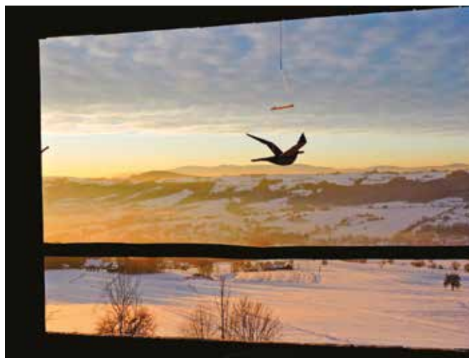
„Widok od Barabioka - Pisarzowa”