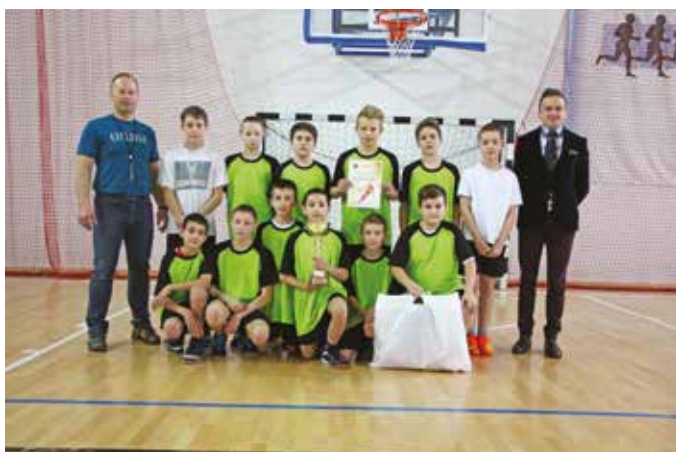
SP Pasierbiec – Mini Piłka Koszykowa Chłopców

ufundowane przez Wójta Gminy Limanowa, a najlepsze trzy zespoły dodatkowo puchary. Poniżej przedstawiamy zwycięzców eliminacji gminnych: