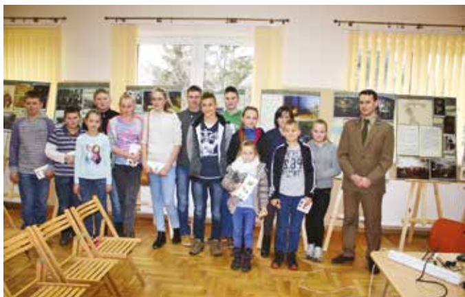
Zimowe spotkanie z leśniczym w bibliotece w Nowym Rybiu