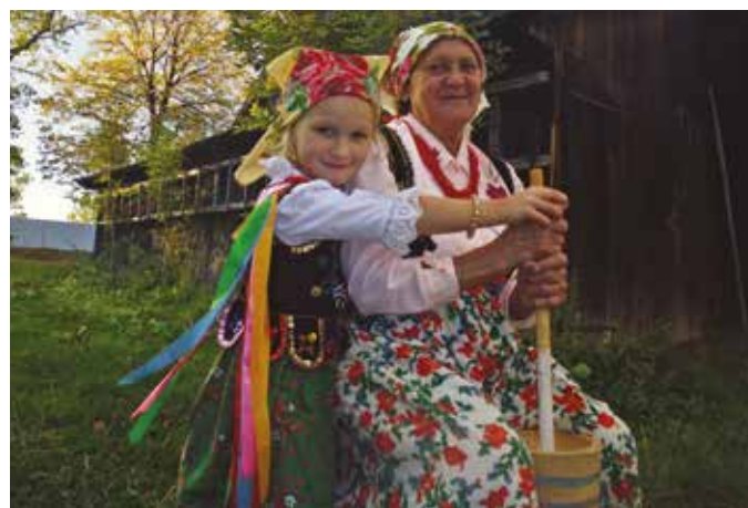
„Ludowe stroje w praktyce”

Uroczyste podsumowanie konkursu miało miejsce dniu 19 lutego br. na sali konferencyjnej Urzędu Gminy Limanowa. Warto nadmienić, iż nagrodzone fotografie można oglądać w budynku UG Limanowa.