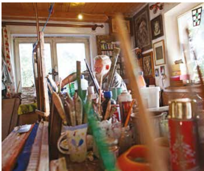
„Artysta przy pracy”