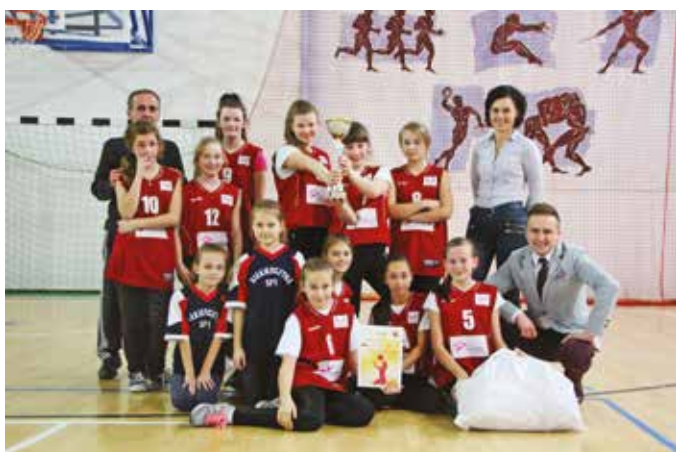
SP Siekierzyna I – Mini Piłka Koszykowa Dziewcząt