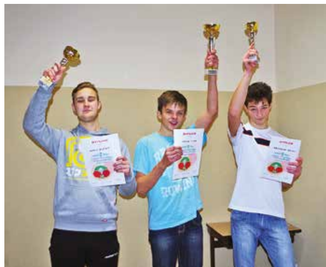
Turniej gry O Lodową Piłeczkę w świetlicy w Pisarzowej