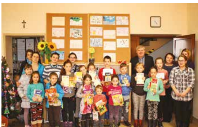
Konkurs plastyczny w bibliotece w Starej Wsi