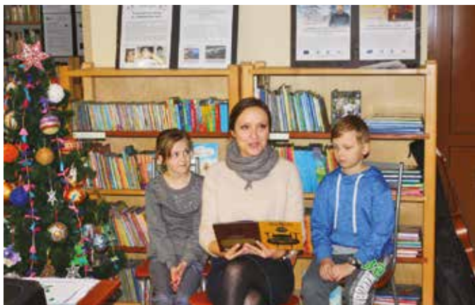
Spotkanie z aktorką Ewą Brajner-Leonowicz w bibliotece w Starej Wsi