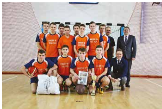
Gimnazjum Stara Wieś I – Piłka Koszykowa Chłopców