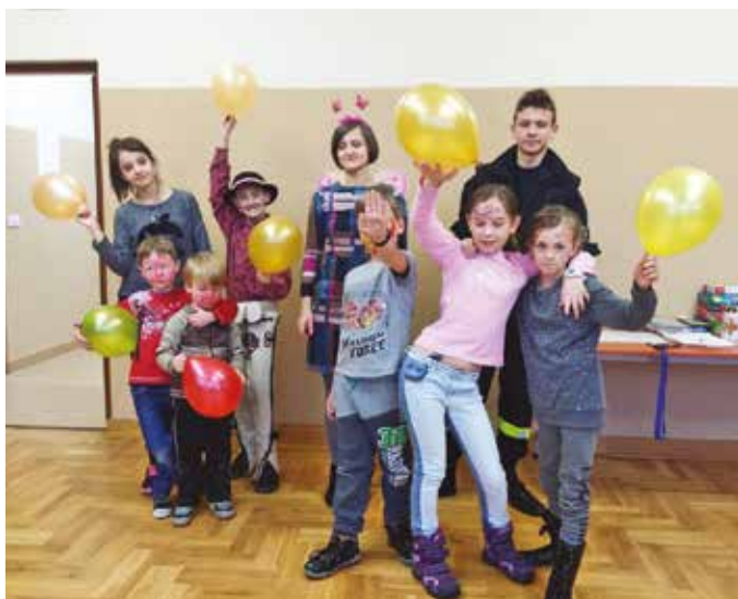
Bal karnawałowy w świetlicy w Starej Wsi

miały okazję rozwijać swoje talenty i zainteresowania. W świetlicach zorganizowano także bale karnawałowe, a dzieci lubiące rywalizację sportową miały okazję uczestniczyć w turniejach i zabawach ruchowych, wygrywając przy tym atrakcyjne nagrody.