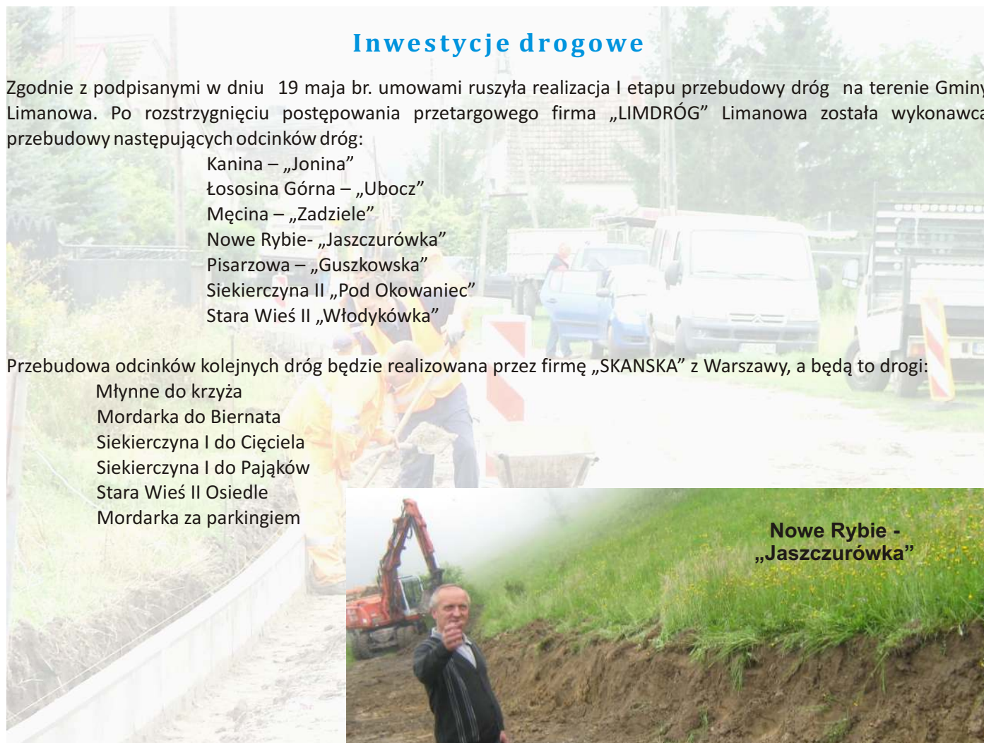
Nowe Rybie - „Jaszczurówka”

Młynne do krzyża Mordarka do Biernata Siekierczyna I do Cięciela Siekierczyna I do Pajaków Stara Wieś II Osiedle Mordarka za parkingiem