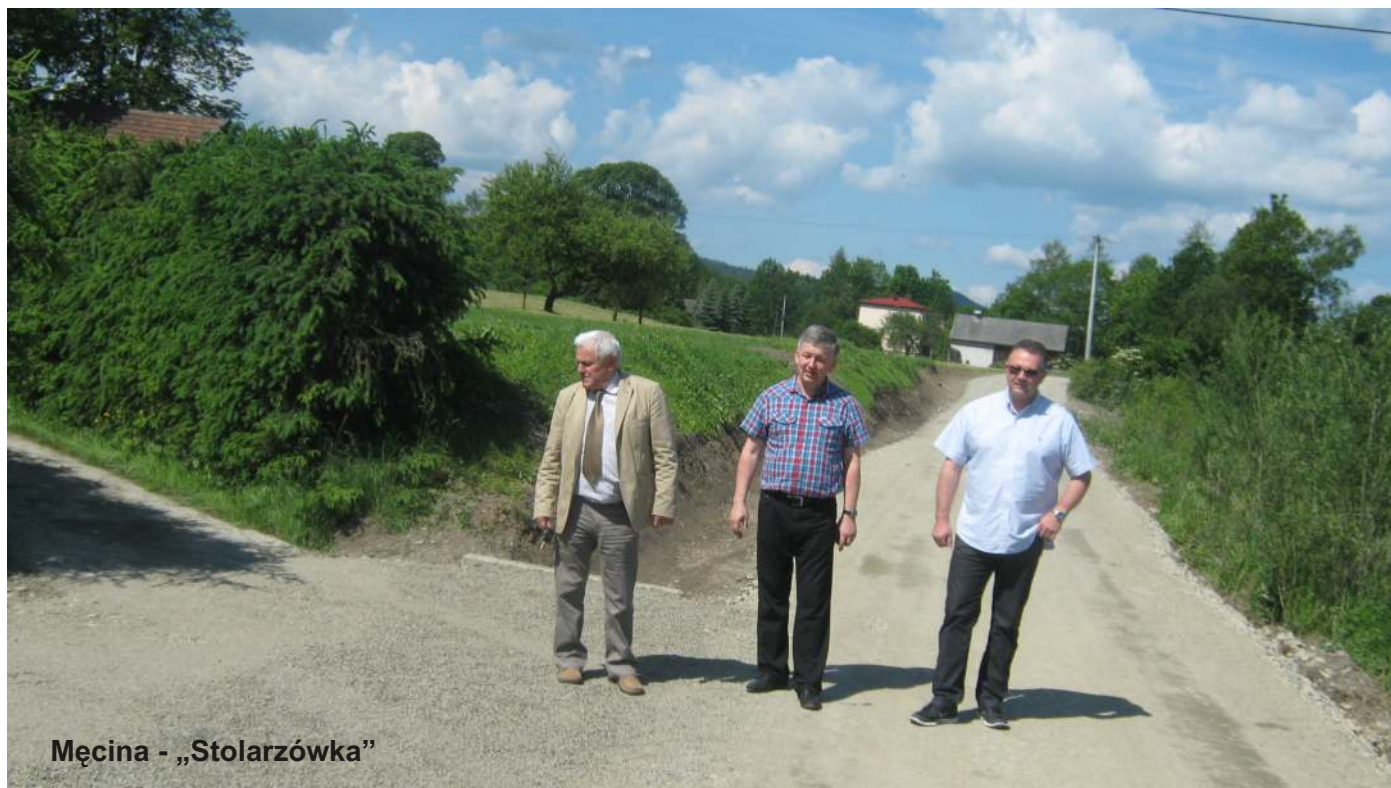
Męcina - „Stolarzówka”

O postępach w realizacji poszczególnych zadań będziemy informować na bieżąco na stronie internetowej Gminy Limanowa www.ug.limanowa.pl oraz w kolejnych wydaniach biuletynu „Wiadomości Gminne”.